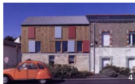
4. Bureaux et appartement à Nantes - Arch. Agence K