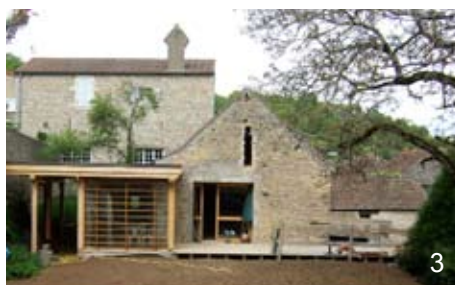
3. Extension d'une maison à Givry - Arch. Vieuxmaire

2. Soit l'extension se différencie de l'existant par ses volumes et le langage architectural utilisé : le résultat escompté est que l'extension est alors clairement identifiée tout en établissant un dialogue harmonieux avec ce qui préexistait.