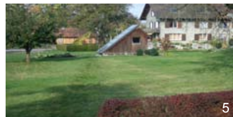
5. Cabanon de jardin - Autriche

Leur implantation (voir fiches "Vers un projet de maison"), leur volumétrie, le choix des matériaux... influenceront sur la qualité et l'ambiance des espaces intérieurs et extérieurs ainsi créés. Ces constructions seront, autant que possible, travaillées en relation avec les bâtiments existants, sans pénétrer trop loin dans le terrain.