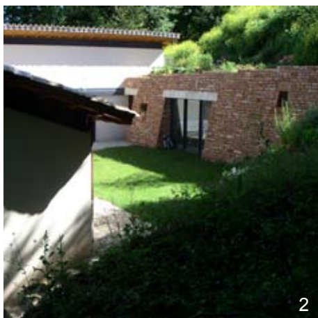
1. Maison à Villiers-en-Morvan - Arch. At. Correia 2. Agrandissement d'une maison individuelle à Charbonnières - Arch. Salvoldelli