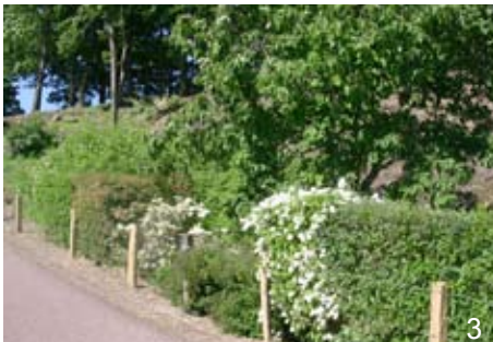
1. Haie libre d'arbustes - 2 et 3. Haies taillées - 4. Arbres mêlés à une haie variée d'arbustes champêtres.