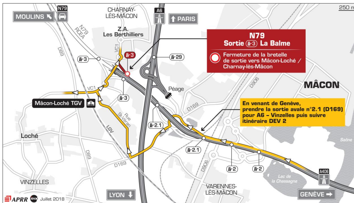
Carte disponible sur demande

En venant de Genève, fermeture de la sortie n°3 (La Balme) pour Mâcon Loché et Charnay-lès-Mâcon.