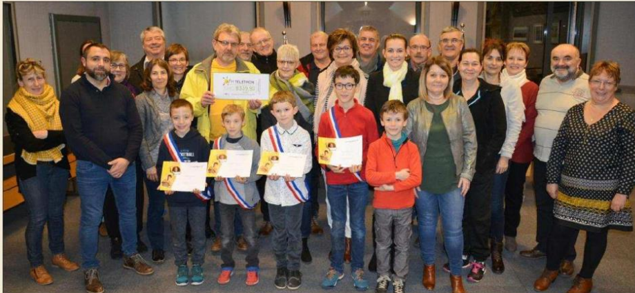
Le chèque des bénéficiaires 2019 a été remis à l'Association française contre les myopathies.

Une somme record de 8 339 € collectée au profit du Téléthon