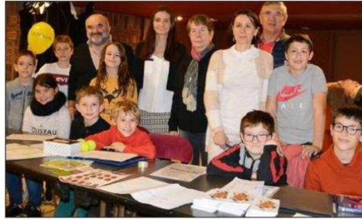
Le Comité de jumelage et le Conseil communal des enfants étaient aussi mobilisés.

Nous avons récolté 521 €. Bravo à tout le monde !