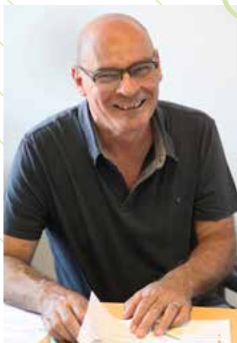
Directeur : Éric DIOCHON

Installée à la Bâtie, dans des locaux adaptés à l'enseignement artistique et aux pratiques collectives, elle est un lieu d'apprentissage musical et théâtral.